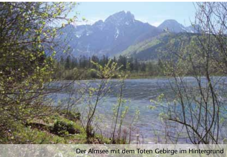
Der Almsee mit dem Toten Gebirge im Hintergrund

Ich spreche jetzt nicht so komplexe Entwicklungen wie Computertechnologie, Smartphone, etc. an, wo wir zum Teil das Mitlaufen schon aufgegeben oder erst gar nicht aufgenommen haben. Nein, die Zeit läuft uns zu oft schon ganz allgemein davon – bei den alltäglichen Verrichtungen und Routinearbeiten, für die wir mehr Zeit als früher benötigen. Oder bei den Aufgaben, mit denen wir unsere Kinder und Enkelkinder unterstützen und entlasten wollen, etc.