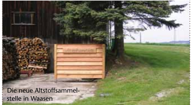
Die neue Altstoffsammelstelle in Waasen