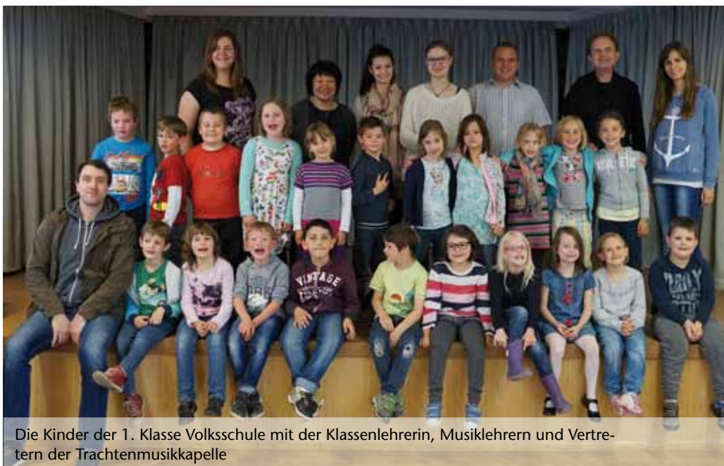
Die Kinder der 1. Klasse Volksschule mit der Klassenlehrerin, Musiklehrern und Vertretern der Trachtenmusikkapelle

Beim Ausprobieren und Kennenlernen waren die Kinder mit großem Eifer und Interesse dabei. Ein herzliches Dankeschön an die Klassenlehrerin für die Betreuung und Durchführung dieser besonderen Instrumentenkunde.